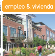
empleo & vivienda