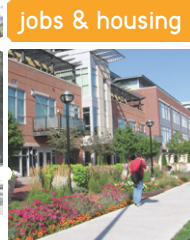
jobs & housing