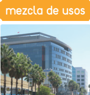
mezcla de usos